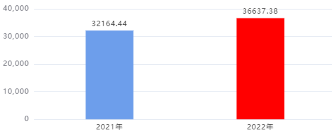
收入、支出决算总计对比图（单位：万元）

2022年度收入总计、支出总计均为36,637.38万元，与上年相比收入总计、支出总计均增加4,472.94万元，增长13.91%，增长的主要原因是：项目增加。