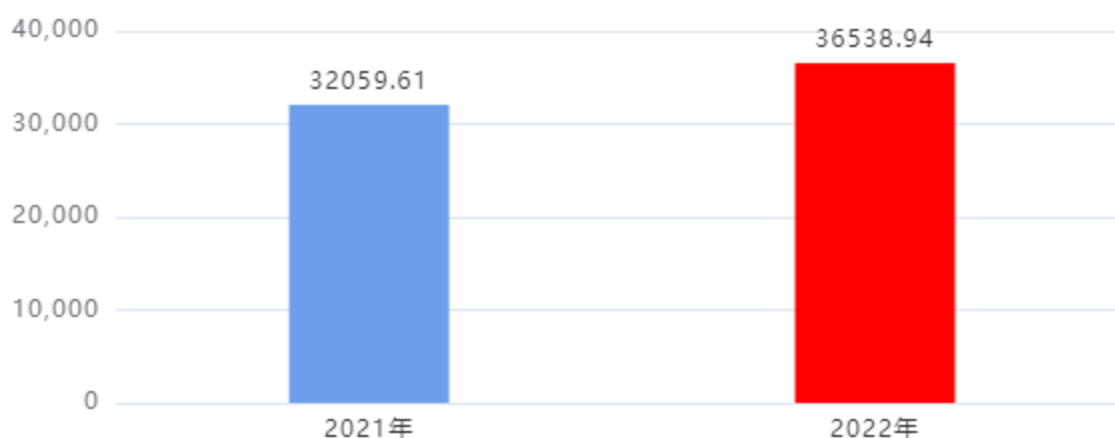
财政拨款收入、支出总计对比图（单位：万元）