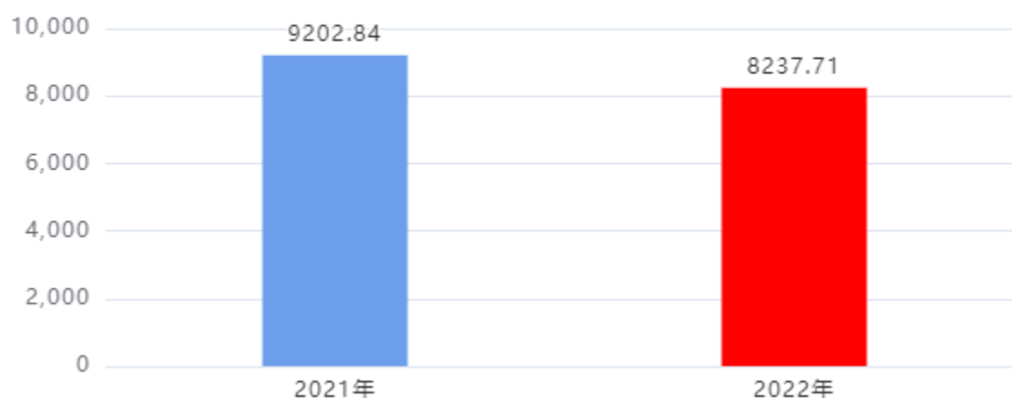
财政拨款支出对比图（单位：万元）

2022年度一般公共预算财政拨款支出年初预算5,019.41万元，支出决算8,237.71万元，完成年初预算的164.12%，占本年支出合计的22.54%。与上年相比，财政拨款支出减少965.13万元，下降10.49%，下降的主要原因是：一般公共预算拨款项目减少。