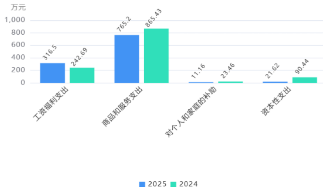
支出按部门预算支出经济分类对比图

2. 按照政府预算支出经济分类，本单位当年一般公共预算支出1,114.48万元，其中：